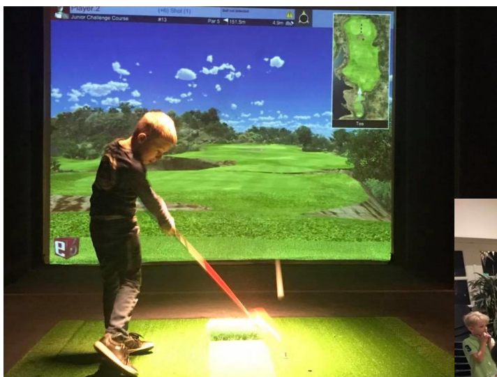
Dyb koncentration under turneringen i Simgolf

Lad græsset blive grønt og solen skinne konstant med 20 grader, det har vi alle fortjent.