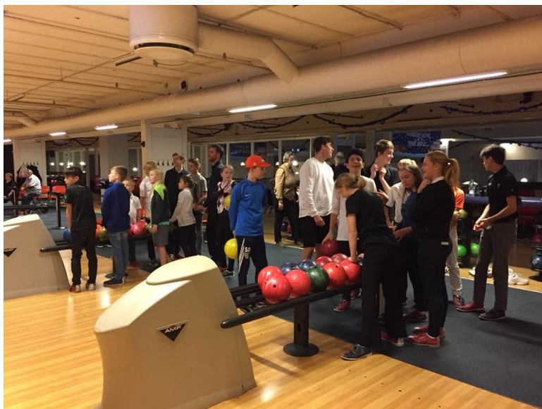
Som afslut på en dejlig dag, spillede alle Bowling.