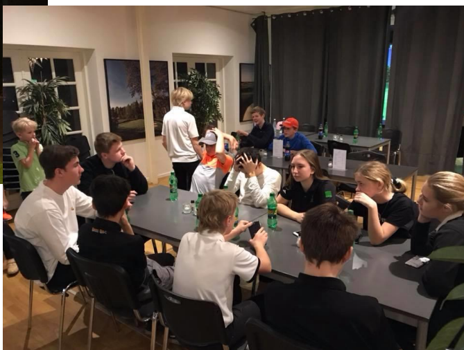
Efter spillet spiste alle "lav selv Burger".