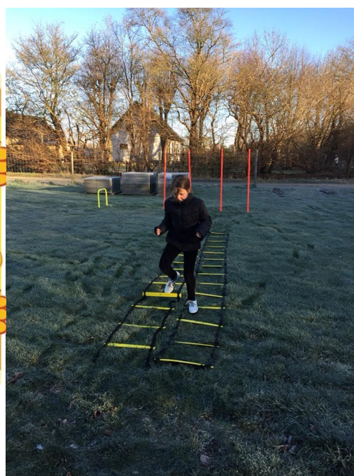
Nanna går til den under træningen på den anlagte træningsbane